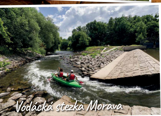
Vodácká stezka Morava