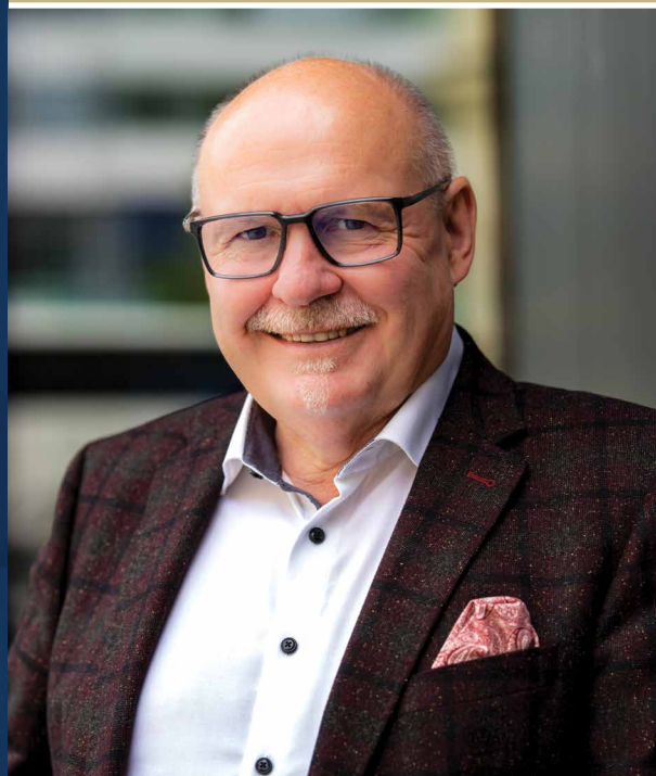
Ladislav OKLEŠTĚK hejtman Olomouckého kraje